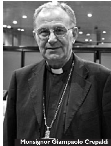
Monsignor Giampaolo Crepaldi

del 1967 nel documento del 1987 riguardo al concetto di sviluppo? L'aspetto di novità della Sollicitudo rei socialis è l'indicazione della solidarietà. Il vero sviluppo ha una natura morale ed è frutto della solidarietà. Un'altra novità è la sottolineatura della differenza tra progresso e sviluppo. A vent'anni dalla Populorum progressio , Giovanni Paolo II fa un bilancio di quei 20 anni di "progresso" e afferma che «non può ridursi a problema "tecnico" ciò che, come lo sviluppo autentico, tocca la dignità dell'uomo e dei popoli. Così ridotto, lo sviluppo sarebbe svuotato del suo vero contenuto e si compirebbe un atto di tradimento verso l'uomo e i popoli, al cui servizio esso deve essere messo».