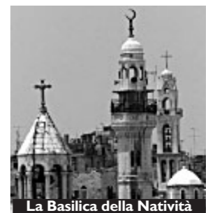
La Basilica della Natività